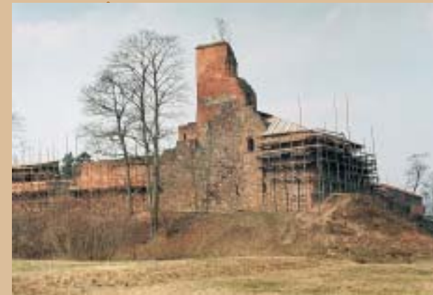
◆ Medininkų pilis