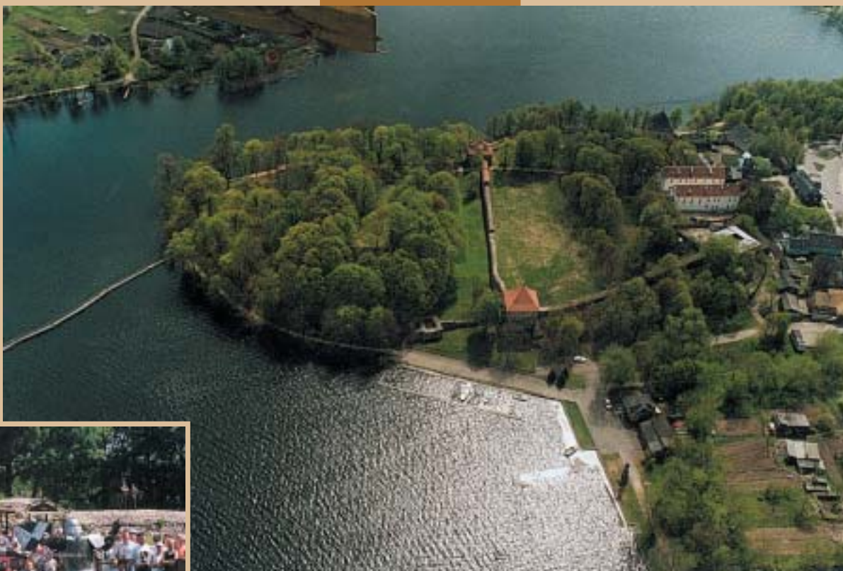
● Trakų pusiasalio pilis

Archeologinių vietų žvalgymas iš oro. Viešoji įstaiga KULTŪROS PAVELDO IŠSAUGOJIMO PAJĖGOS Piliakalnio g. 10, LT-2003 Vilnius, El. paštas: vagne@delfi.lt