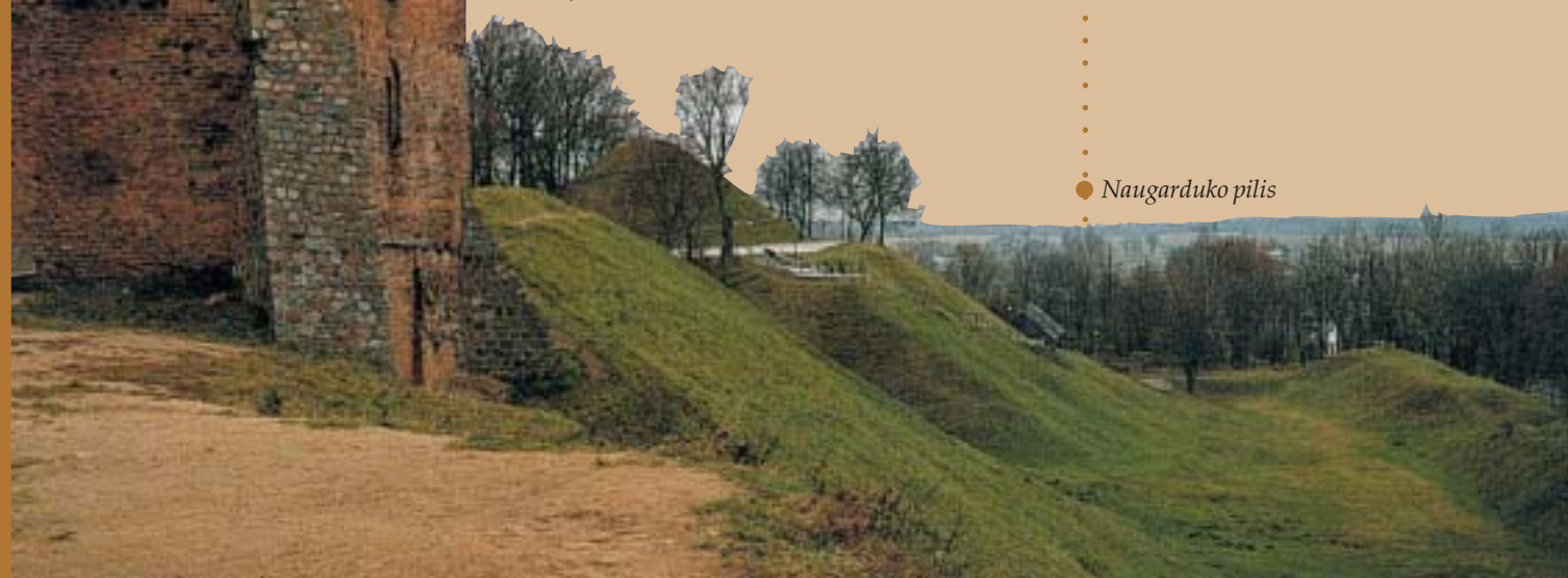
◆ Naugarduko pilis